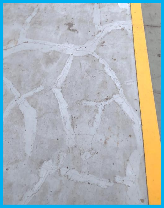
ヒビ補修後の塗装例