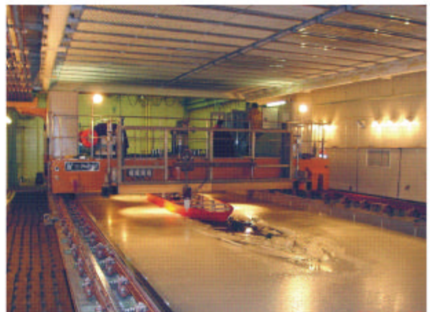
氷海船舶試験水槽