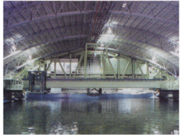
構造海洋物試験水槽