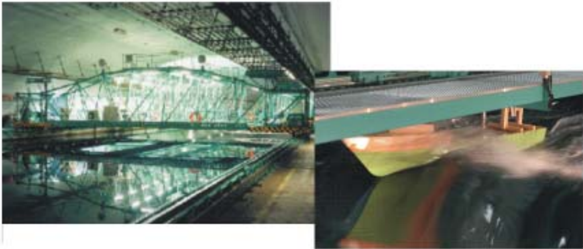
400m 試験水槽と高速艇波浪中実験