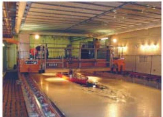
氷海船舶試験水槽