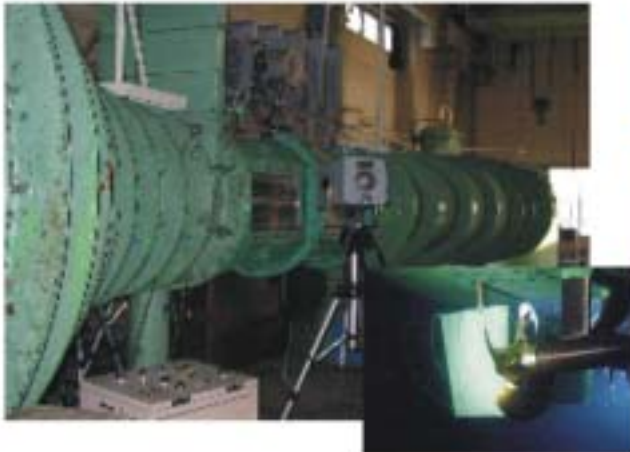
船尾変動圧計測 大型キャビテーション試験水槽