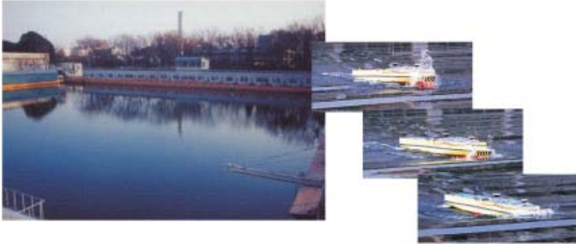
80m 角水槽と波浪中自由航走模型実験（高速カーフェリー）