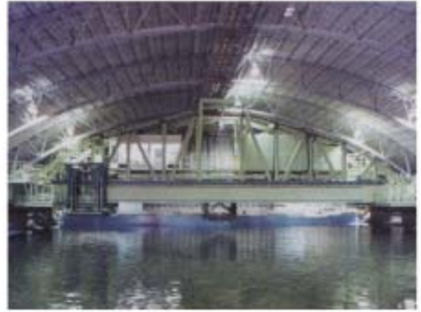
海洋構造物試験水槽