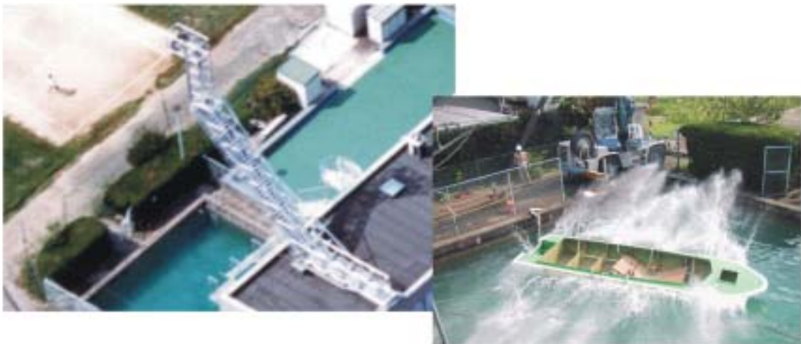
救命器具落下試験設備と FRP 接合船落下衝撃試験（大阪）