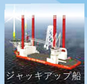
DPシミュレータと使用可能なDP船 Dynamic Positioning Simulator and vessels