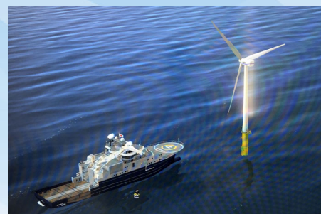
洋上風力発電施設へのアプローチ操船の様子 Approach to an offshore wind turbine

DPシミュレータご利用に関するお問合せ E-mail: dp-service@m.mpat.go.jp (担当 横井/前田)